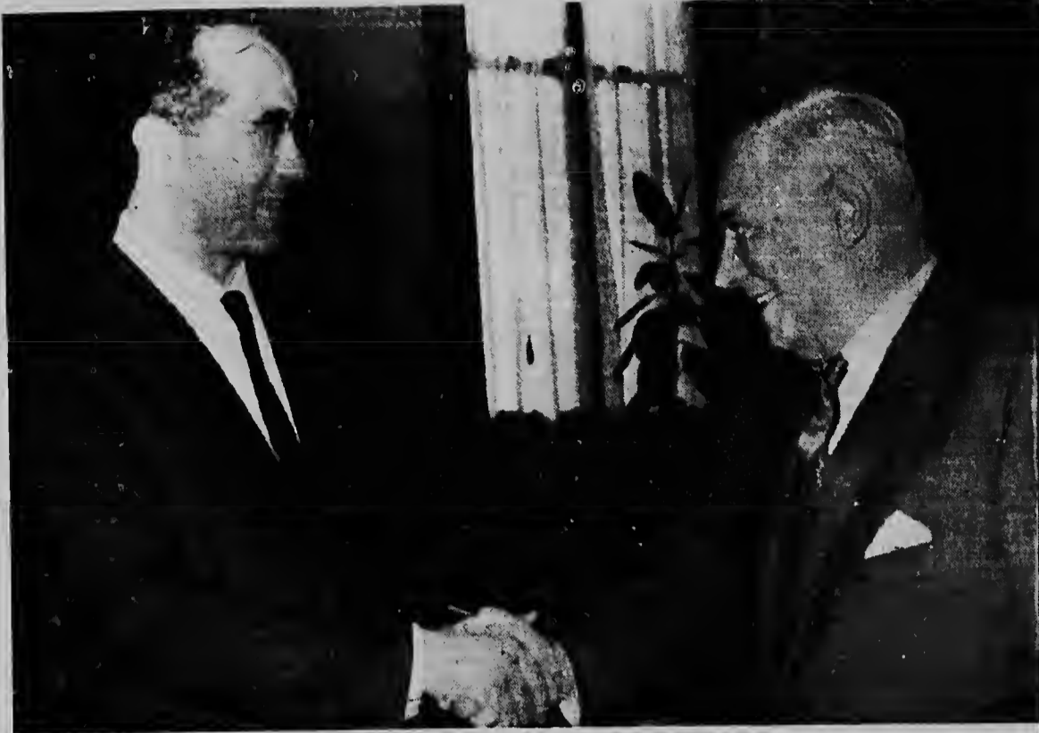
ROMA - E minister di Asuntunan Economico di Argentina, Juan Carlos Pugliese - na man drechi - aki ta ser saluda pa e minister di Finanzas di Italia, Emilio Colombo, na yegada di e minister Argentino na Roma caminda el a bin conferencia cu autoridadnan italiano tocante e plannan di desarrollo di Argentina.

John Farrel, di 50 anja, chofer di un truck di "Daily News" tabata aparentemente e unico testigu di e inmolacion di Laporte. Farrel a bisa cu el a caba di bira e skina ora cu el a mira Laporte na candela. "Tur loque mi por a mira tabata e vlamnan--Farrell a bisa--despues mi a mira e pia, y e ora el mi a hanja sa cu tabata un hombre. Despues cu polisnan y ambulance a bai for di e lugar, un reporter di United Press International a mira un paar di zapato y algun moneda y restunan kima di un carson riba caya. Laporte a comete suicidio un siman despues cu un habitante di Baltimore Norman R. Morrison a bula for di un misa di Washington, como protesta pa e politica norteamericano na vietnam Morrison, tata di tres yiu, a tira su curpa for di e misa na momento cu empleadonan di e departamento di defensa tabata bandona e edificio.